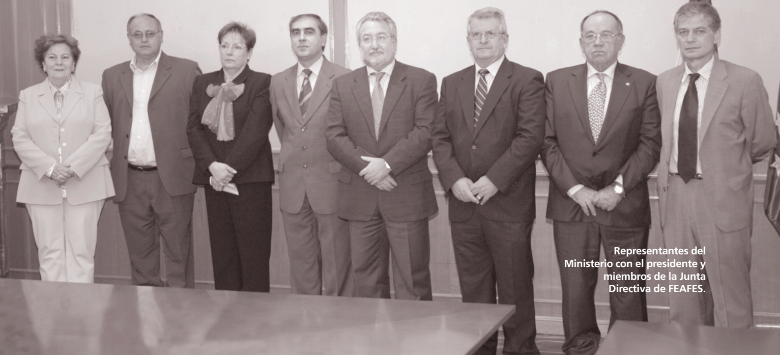
Representantes del Ministerio con el presidente y miembros de la Junta Directiva de FEAFES.

“LA SALUD MENTAL EN UN MUNDO CAMBIANTE. EL IMPACTO DE LA CULTURA Y LA DIVERSIDAD”, LEMA ADOPTADO PARA EL DÍA MUNDIAL DE LA SALUD MENTAL