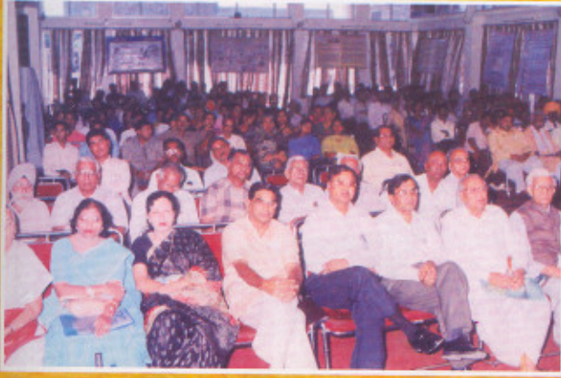
मानसिक स्वास्थ्य दिवस पर उपस्थित गणमान्य लोग Senior Citizen, Member of NOG's, Patients & Relatives